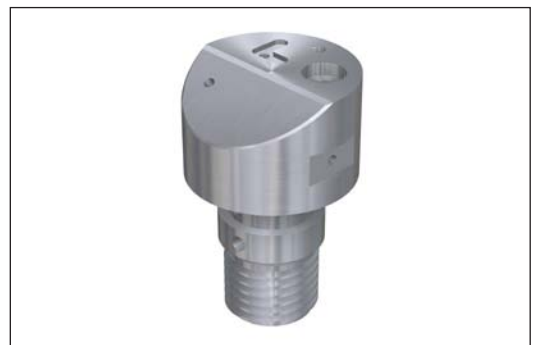
Composants de dimension aillant jusqu'à 80x80x80mm ou Ø65mm L100 peuvent être usinés efficacement.